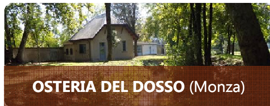
OSTERIA DEL DOSSO (Monza)